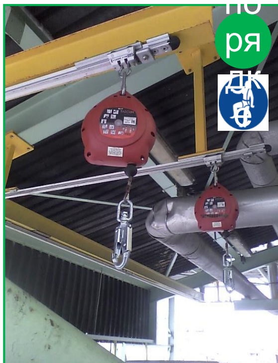
Защитное устройство от падения с высоты, подсоединенное к вашему нательному ремню безопасности