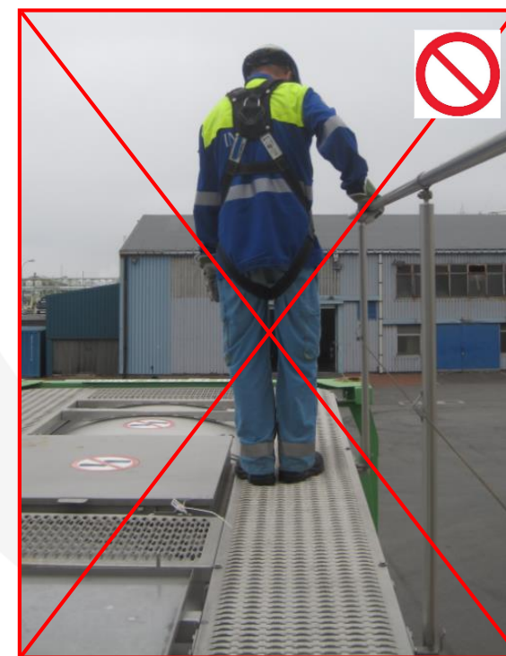
Поручень без предохранения от падения