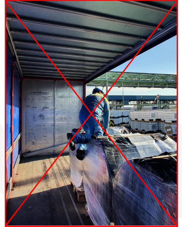
Nu este permisă cățărarea pe marfă