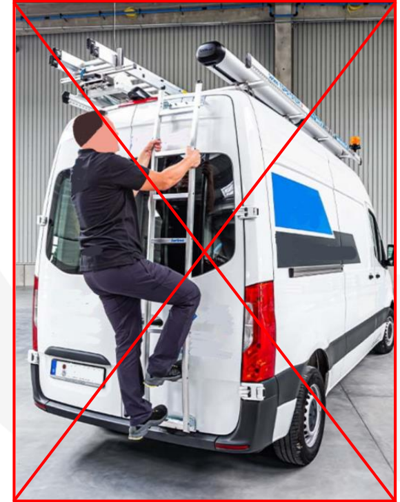
Nu este permis cățărutul în partea superioară