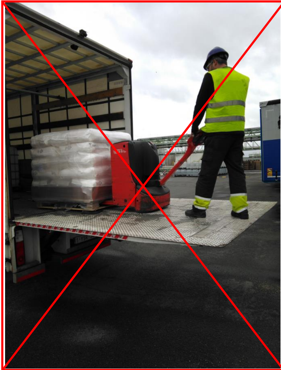
Lift hidraulic: folosirea necorespunzătoare a transpaletului