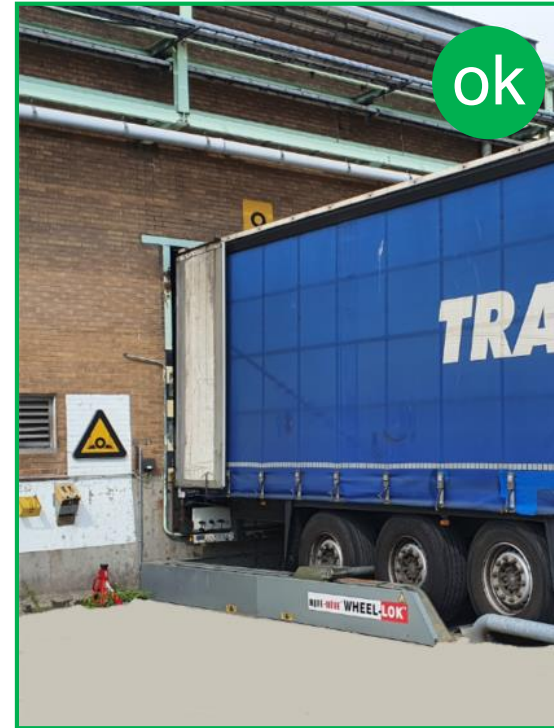
Rampă de încărcare cu plăcuță de frână sau dispozitiv de blocare a roților