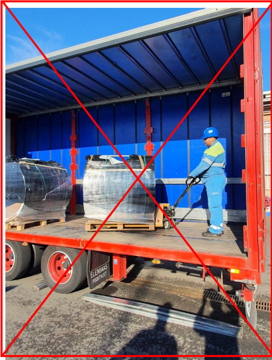
Deschideți lateral: utilizează transpaletul