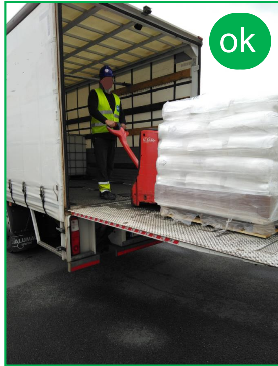
Lift hidraulic: folosirea corespunzătoare a transpaletului