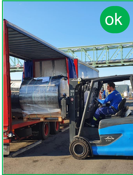
Deschideți lateral: folosiți stivitorul